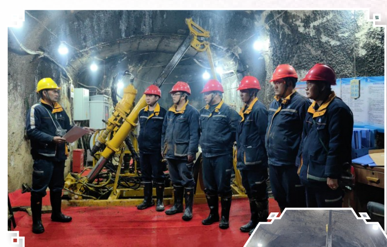
图为中铝勘查进行钻探施工技术交底。