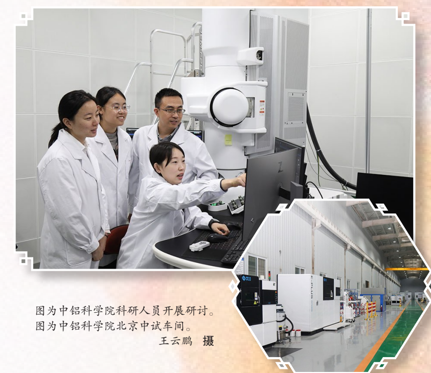
图为中铝科学院科研人员开展研讨。图为中铝科学院北京中试车间。

先进制程半导体材料实验平台建设于2026年初正式启动，截至目前已完成中试平台全部设备采购方案编制、场地