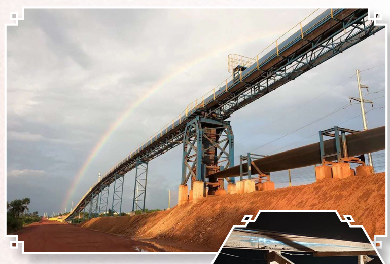
图为中铝几内亚皮带更换项目建设现场。

皮带现场更换阶段，团队紧扣时间节点无缝衔接，择机停机后快速完成皮带设置、新旧皮带牢固连接，新皮带就