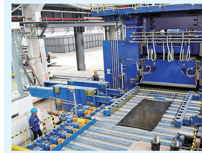
▲图为冷轧产品成功下线。

本次试轧聚焦核心工艺突破，成功将板坯厚度由118毫米缩减至18毫米，总加工率高达84%，远超行业常规加工水平，产品公差稳定受控，设备能力冗余充足，充分验证了轧机的重载轧制冗余能力，全面检验了目前最宽铜板冷轧机设备的核心性能，为后续工艺优化及全线投产工作筑牢根基。 作为高端铜材深加工的核心装备，3500毫米铜及铜合金宽厚板冷轧机组兼具冷轧、热轧双重功能，通过辊缝间微米级精准调节，从根本上解决了大宽幅铜板轧制过程中厚度不均、板形波动等行业共性难题，实现了微米级精度与重载轧制能力的协同突破，为生产高精度、宽幅面铜及铜合金板材提供了核心支撑。 当前，洛阳铜加工提质扩能及设备升级改造重点项目正加快推进后续规格试轧及全线联动试生产，稳步向规模化、高端化生产模式迈进。（均 琳）