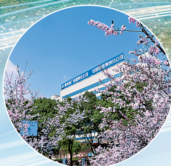
图为贵州铝厂办公楼。