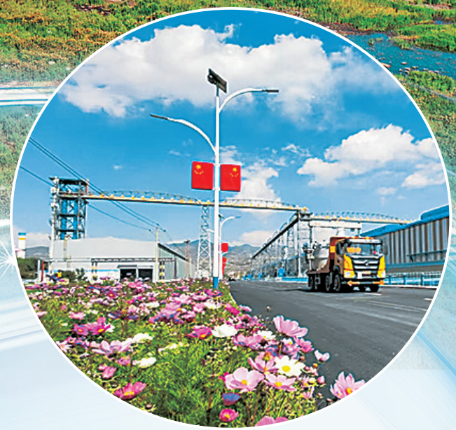
图为中铝股份青海分公司厂区。