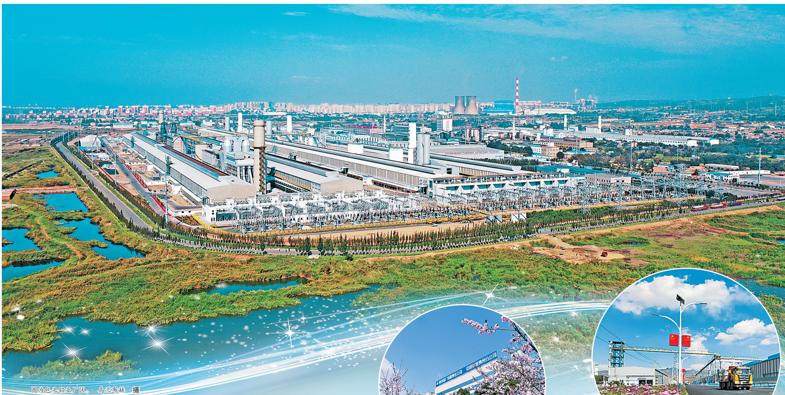
图为包头铝业厂区。