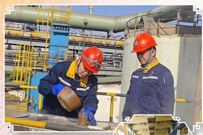
图为驰宏综合利用制液作业区技术团队工作场景。