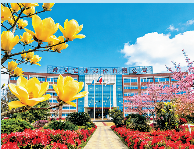
图为遵义铝业氧化铝片区办公大楼。