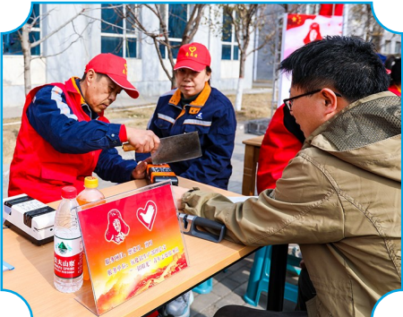
图为山西华兴志愿者为居民打磨刀具。