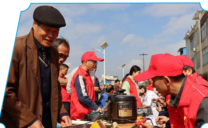
图为中铝股份广西分公司志愿者为居民维修家电。