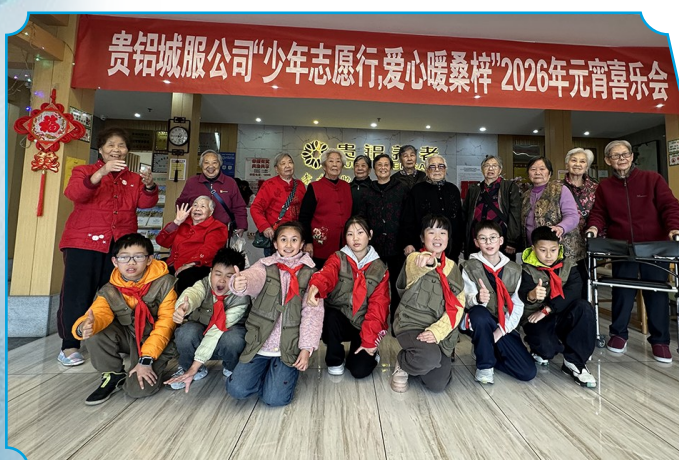
图为由贵铝铝业员工子女组成的“红领巾”志愿者与贵铝智慧孝福苑老人共迎元宵。