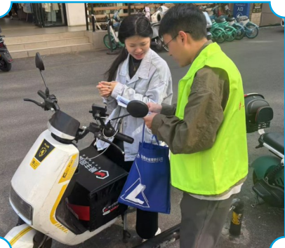
图为云晨期货志愿者向居民普及金融知识。