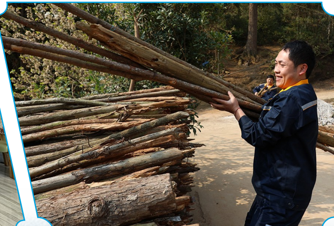
图为云铝文山志愿者开展帮扶活动。