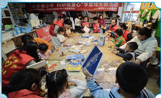
图为中铝科学院、中铝材料院“大手牵小手 科研暖童心”学雷锋主题活动现场。