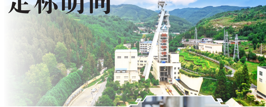
▲图为会泽矿业三号竖井。

长沙院召开九届八次职代会暨2026年工作会,传达学习习近平总书记重要指示精神,学习贯彻中铝集团、中铝国际职代会精神,全面总结2025年及“十四五”工作成效,系统部署2026年重点工作。