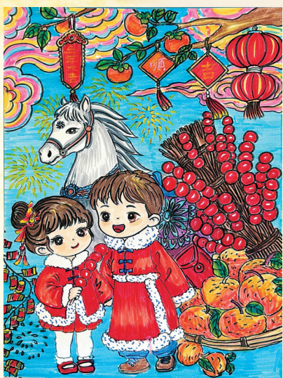
水彩画 云铝鑫森 董宇涓