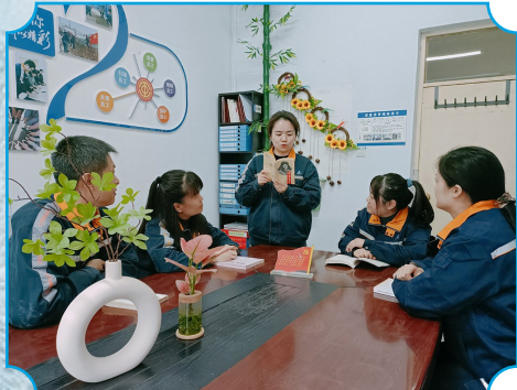
图为郑州铝业员工诵读《雷锋日记》。