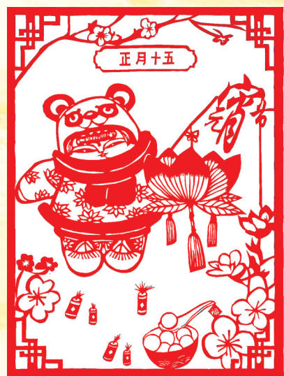
剪纸 宁电物流 杨海容