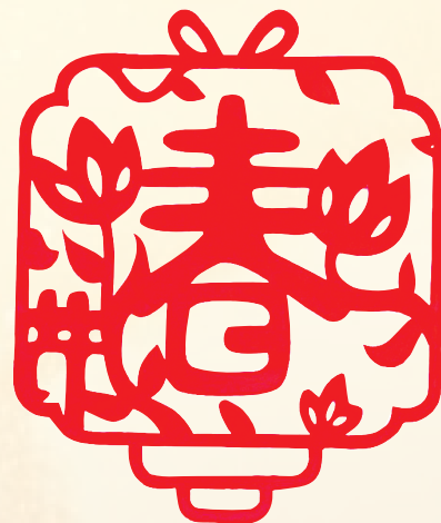
剪纸 包头铝业 乔培婷