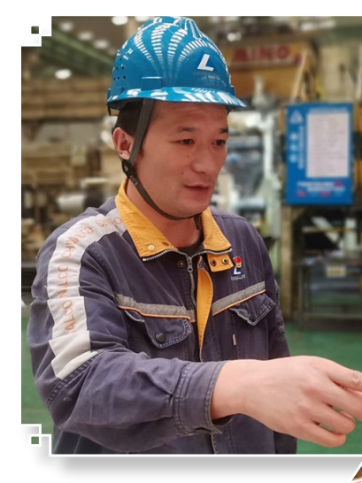
图为华中铜业生产现场。

此外,随着“四定”改革深入推进,华中铜业内设机构数量同比减少28.57%,用工总量同比减少5.5%。差异化考核体系突出价值创造,一线主操岗位薪酬平均