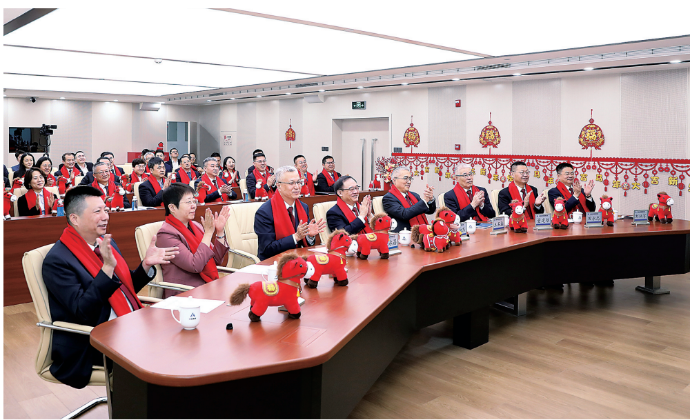
▲图为中铝集团2026年新春团拜会现场。

段向东指出，2025年的每一份坚守、每一个足迹、每一项成绩，都是践行习近平总书记殷殷嘱托的生动实践，都是对