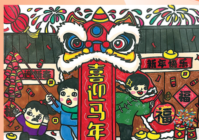
舒欣 9岁 家长 云铝涌鑫 张绕