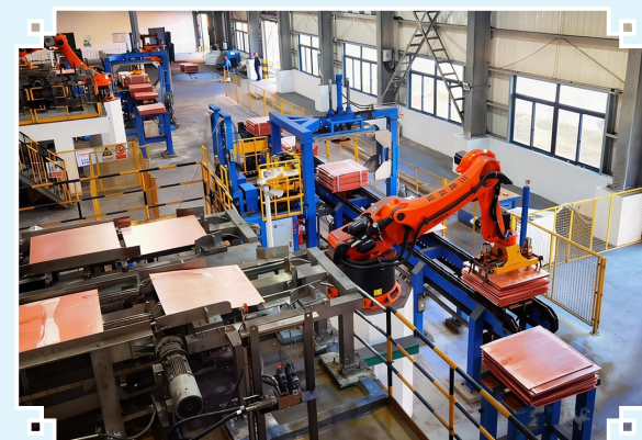
图为滇中有色生产一线。

中国铜业的绿色转型是全产业链的协同共进。采购端的渠道优化、冶炼端的循环增效、加工端的产品创新，通过一体化运营，形成了“资源—能源—产品”的绿色循环。站在新起点，中国铜业将继续锚定绿色发展，发挥“城市矿山”潜能，从废旧铜料的循环利用到绿色产品的创新升级，从单一环节的节能降耗到全产业链的低碳重塑，为有色金属行业高质量转型、保障国家资源安全贡献中铜力量。