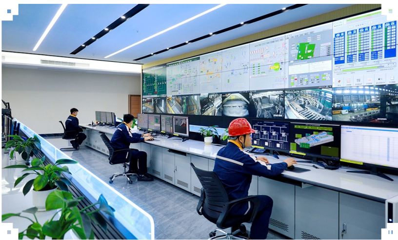
图为中铝股份广西分公司炭素厂集控中心。

面对市场波动，制造部的采购员们化身“精算师”，采取“少量高频、按需采购”策略，2025年大宗物资采购均价低于市场均价8.8%。今年1月，他们的表现依然稳健，各大宗原燃料采购价格全部完成中铝股份设定的市场目标。