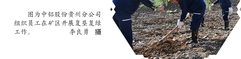
图为中铝股份贵州分公司组织员工在矿区开展复垦复绿工作。

取得关键突破。这一市场捷报，与2025年5月其自主研发的、能攻克零下45摄氏度极寒难题的阳极运输车成功出口哈萨克斯坦一脉相承。国际市场的认可验证了技术的硬实力；国内市场的中标，彰