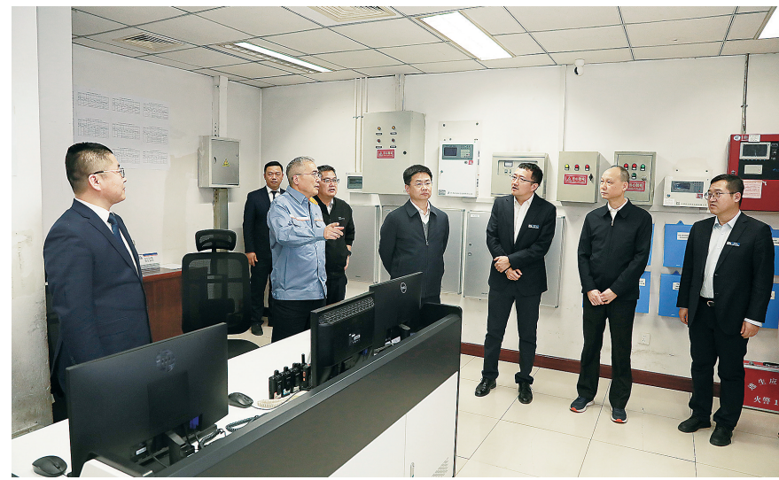
▲图为检查组在中铝大厦开展专项检查。

检查组坚持“全覆盖、无死角、重实效”原则，聚焦京内楼宇消防安全关键环节和薄弱环节，先后深入中铝科技园燃气间、高压配电室、中控室及中铝大厦中控室、计算机数据机房、消防泵补水间、电梯间等重点区域，开展“拉网式”排查。过程中，检查组仔细查看，细查灭火器有效期、消防喷淋设施压力是否正常；测试应急照明、疏散标志能否正常启用；核查疏散通道、安全出口是否保持畅通，电动车停放是否规范，有无加装消防设施；检查操作人员安全知