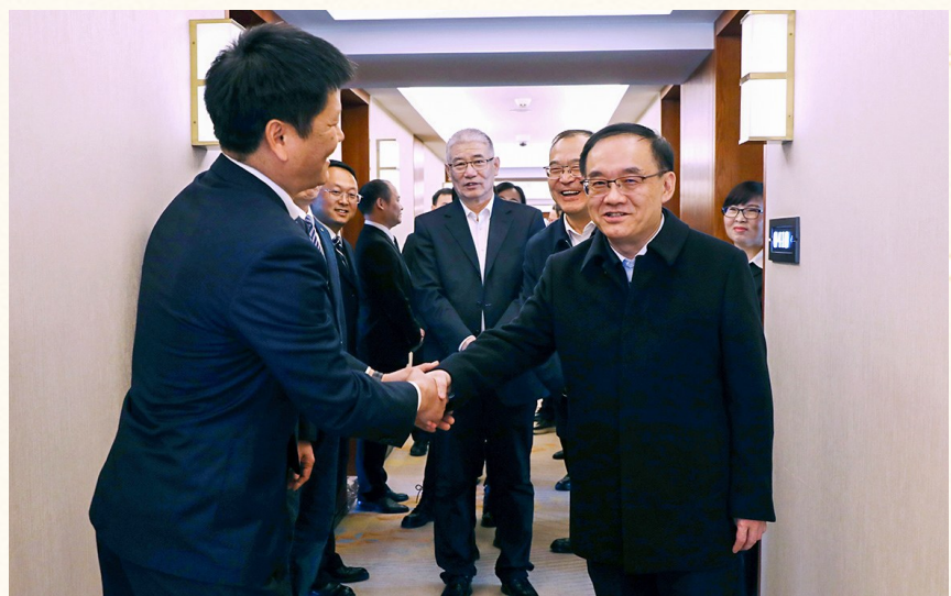
职代会暨2025年度表彰大会的职工代表。图为中铝集团党组领导看望慰问参加二届四次

福感、安全感持续提升。2026年是“十五五”开局之年，中铝集团党组将团结带领全体干部职工，聚焦主责主业，持续增强核心功能，全面提升核心竞争力，为“哪里有资源哪里就是中铝人的家，哪里有事业哪里就是中铝人的家，哪里有市场哪里就是中铝人的主战场”而感动，以认认真真、老老实实、规规矩矩做事的态度，发扬坚韧不拔、不退半步的斗争精神，奋力建设“新中铝”。与会职工代表深受鼓舞，倍感振奋。大家一致表示，将坚持把思想和行动统一到集团党组部署要求上来，进一步坚定发展信心，以一为基，勇争第一，持续保持奋斗姿态，凝心聚力、接续奋斗，全力以赴确保“十五五”开好局起好步，为加快建设世界一流矿业与有色金属集团贡献更大力量。（何丹 阳小芬）