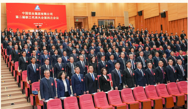
图为与会代表齐唱国歌。