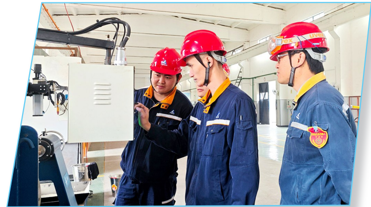
图为活动现场。

本报讯 近日,广西中铝工服组织焊工岗位团员青年开展自动化焊接专业技能培训,讲授自动化焊接的技术难点、性能特点,分享操作经验,帮助员工快速掌握自动化焊接技能。