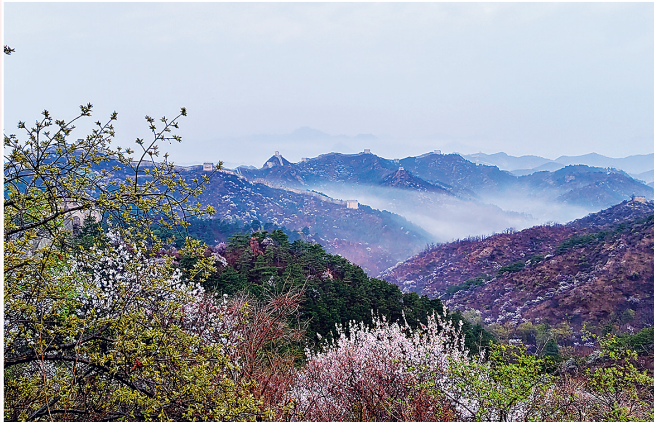
长城之春

人生是一万次的春和景明。在春天,去遇见美好,去放飞希望,去爱一个值得爱的人,去赴一场春天的约会,让每一个春天都因你而明媚。