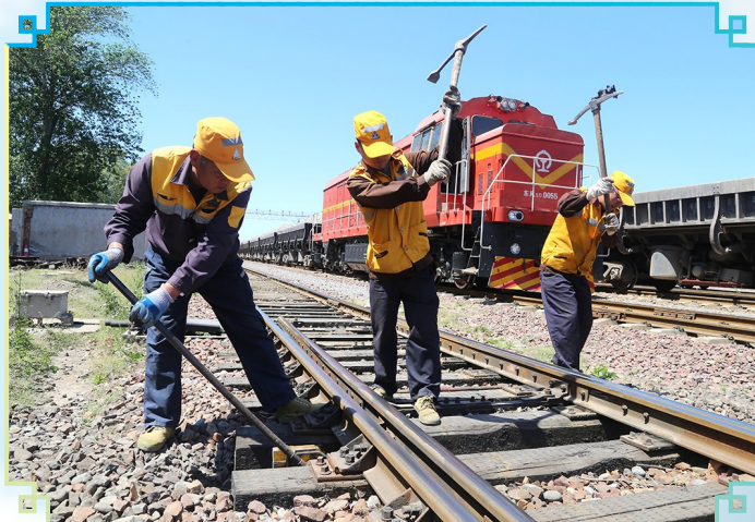
图为中铝物流中部陆港员工检查维护铁路线路。