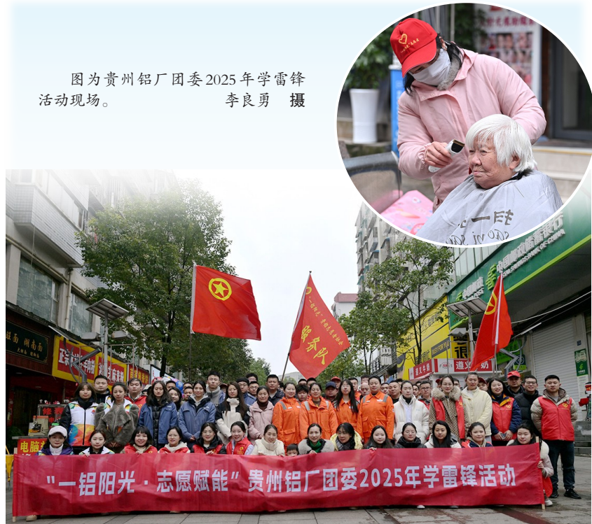
图为贵州铝厂团委2025年学雷锋活动现场。