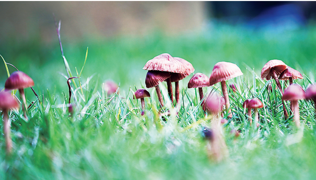
东南铜业 宋兆武 摄 春草