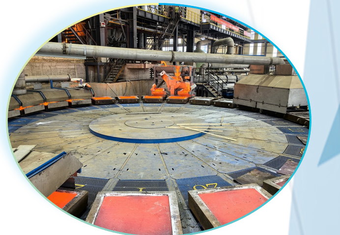
图为西南铜业国内首套双26模四浇包圆盘浇铸。