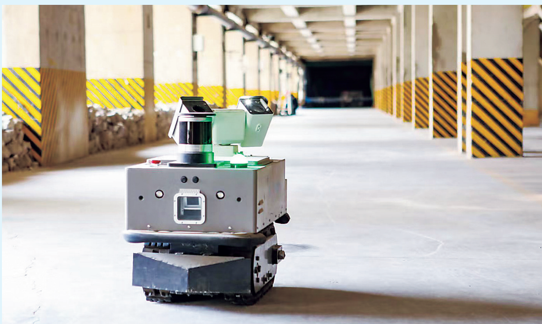
▲图为山西中润引进的电解槽槽底智能巡检机器人。