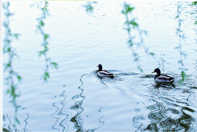
春江水暖