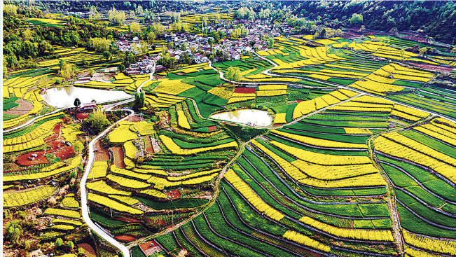
九冶 张帆 摄 醉美田园