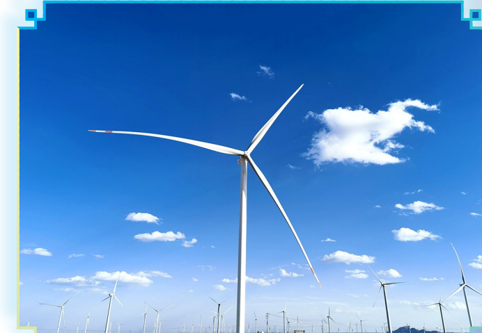
图为银星能源贺兰山风电场91.8兆瓦“以大代小”风电技改项目。