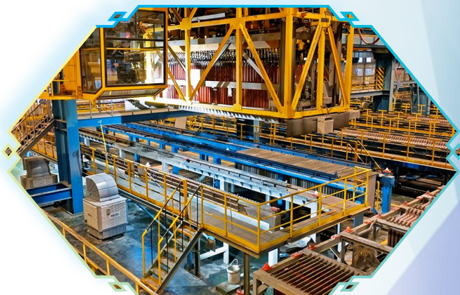
图为东南铜业生产场景。