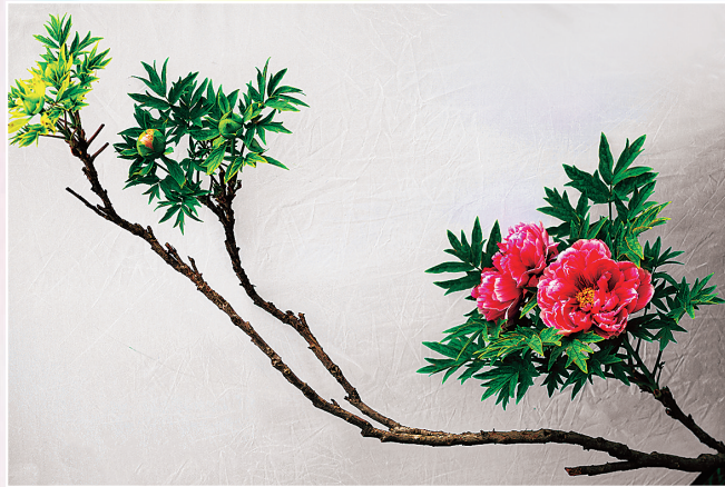
洛阳铜业 天香