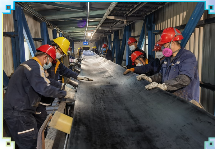
图为彝良驰宏选矿厂组织更换皮带。