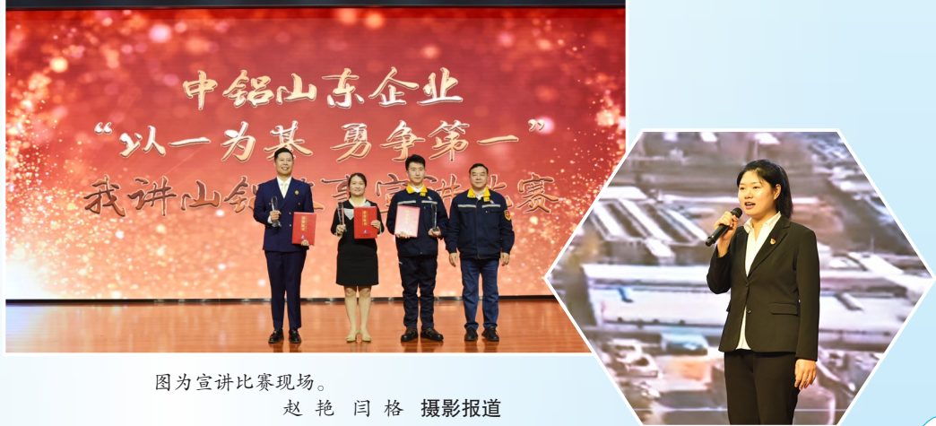
图为宣讲比赛现场。